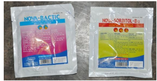
Men và thuốc giải độc gan