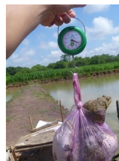
Kiểm tra ếch nuôi 50 ngày tuổi