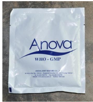
Men tiêu hóa