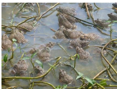
Ếch 50 ngày tuổi ở hộ anh Y Sơ Ly