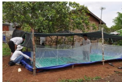
Lồng lưới đặt trong bể giả ở hộ anh Y Sơ Ly