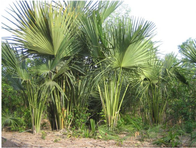
Hình 1: Rừng lá Buông Suối Kiết, Tánh Linh, Bình Thuận