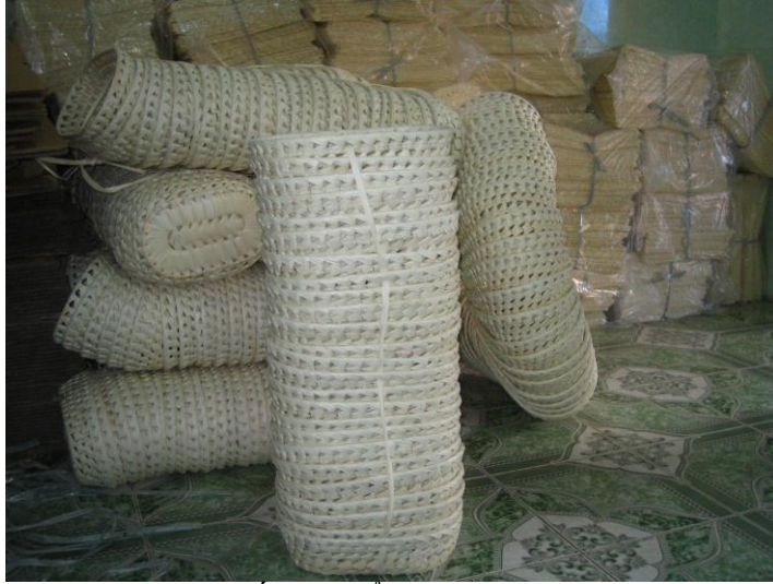
Hình 5: Một số sản phẩm từ lá Bông