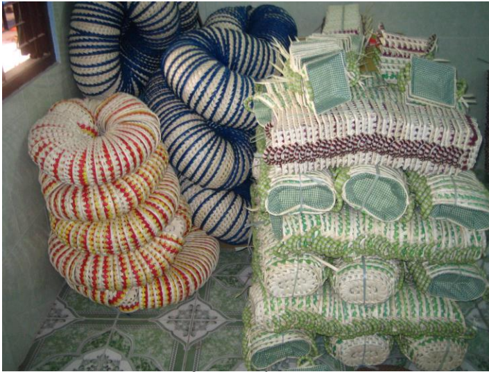
Hình 6: Một số sản phẩm từ lá Bông