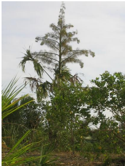
Hình 2: Cây lá Buông già trở bông