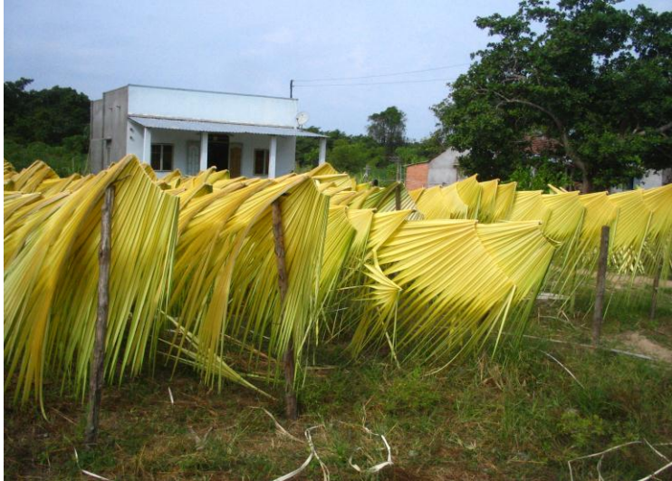
Hình 3: Phơi lá Buông