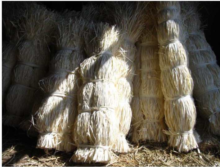
Hình 4: Lá Buông sơ chế thành sợi